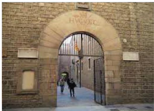
Entrada des del carrer Carme 47