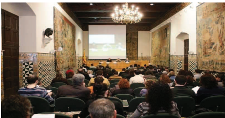
Sala Prat de la Riba